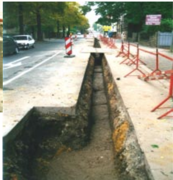
Versuchsstrecke Trierer Straße (B85)