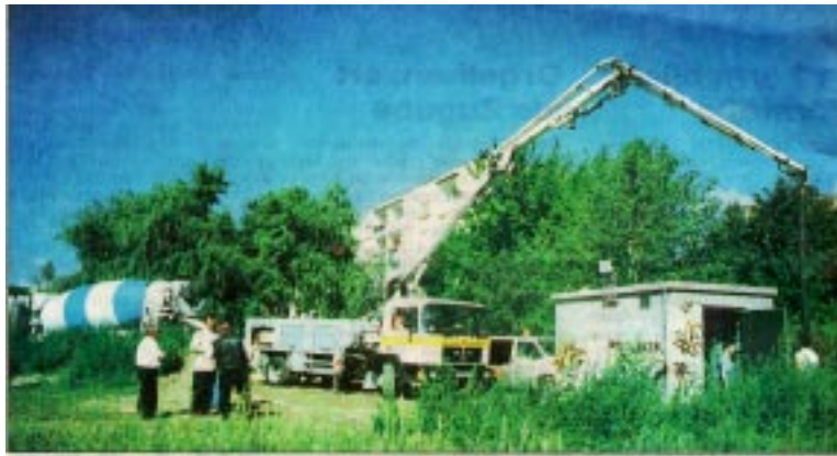
Versuchsbaustelle Gasregelstation Südstrasse Gera