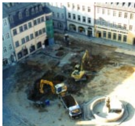
Baustelle Geraer Markt