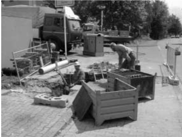
Bild 7: Geringe Baustelleneinrichtung (Gestängeboxen, Berstlafette, Hydraulikstation)