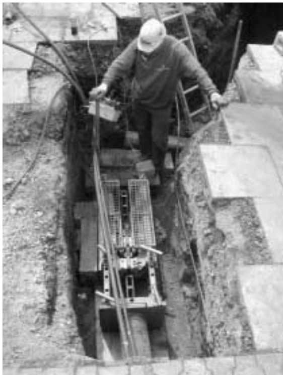
Bild 1: Grundoburst 400 G beim Einschieben der Gestänge in die Altleitung

Kennzeichnend für diese Verfahrenstechnik ist, dass über eine hydraulisch gesteuerte Lafette ein Berstgestänge in eine Altleitung eingeschoben wird, an deren Ende man bei Ankunft in der Einziehgrube (oder -Schacht) einen Berstkörper mit zugehöriger Aufweitung und integriertem Neurohr (Kurz- oder Langrohr) anhängt. Beim Einschubvorgang ( Bild 1 ) sorgt ein birnenförmiger Führungskaliber für die sichere Führung im Altrohr und schließt ein Verkannten aus. Je nach Verfahrensart der einzelnen Hersteller werden diese Gestänge in der Maschinengrube miteinander verschraubt oder zeitsparend kraftschlüssig eingeklinkt (Quick-Lock-Berstgestänge System Tracto-Technik). Ist der Aufweitungs- und Berstmechanismus mit integriertem Neurohr am Gestänge angeschlossen, wird diese Vorrichtung einfach anhand permanent aufgebrachter Zugenergie über die Lafette zurück in die Maschinengrube gezogen. Das Altrohrmaterial wird dabei geborsten ( Bild 2 ) und ins umgebende Erdreich verdrängt, und gleichzeitig wird das neue Rohr eingezogen ( Bild 3 ).