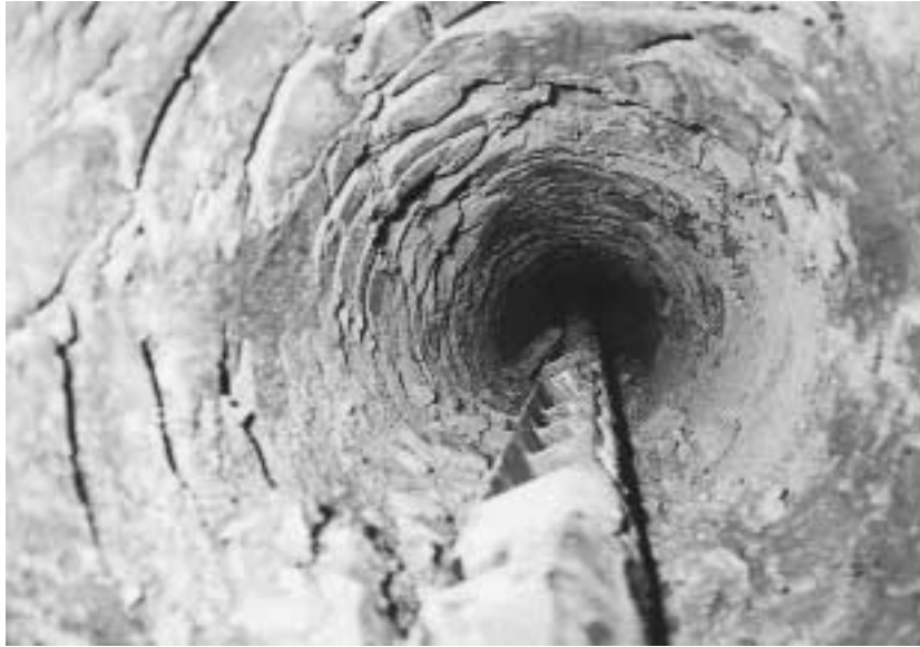
Bild 2: Blick in einen Rohrkanal mit radial verdrängter Scherbenbildung