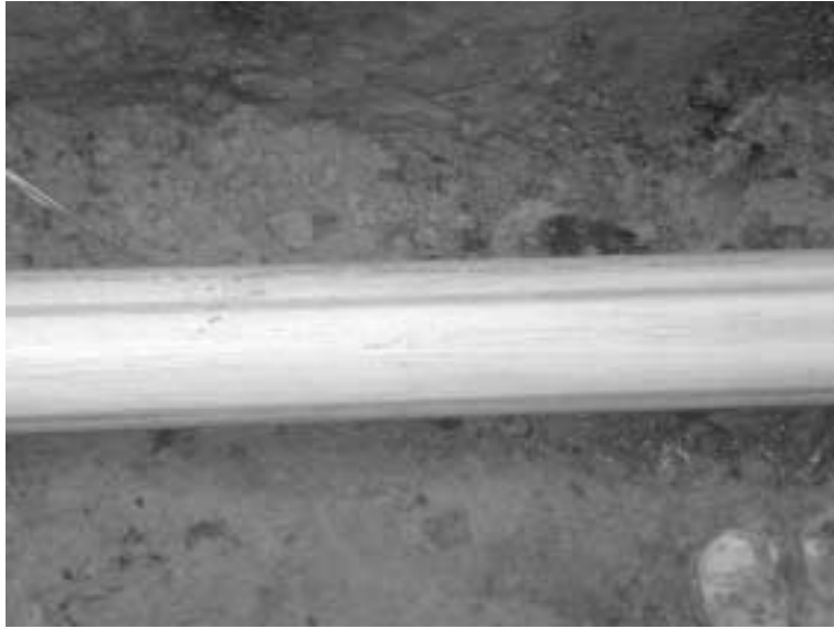
Bild 5: Blick auf ein mittels Berstlining neu eingezogenes Schutzmantelrohr

Ein entscheidender Vorteil in Bezug auf das Bersten und Einziehen von Trinkwasserleitungen ist, dass beim statischen Verfahren das Innenrohr sauber bleibt und nicht mehr, wie es beim dynamischen Verfahren der Fall ist, durch die innen liegenden Luftdruckschläuche für den Bodenverdrängungshammer verunreinigt werden kann.