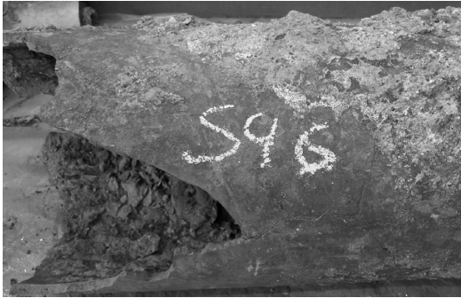
Bild 1: Tragfähigkeitsverlust durch Querbruch und Risse, physisches Ende der Nutzungsdauer