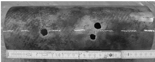
Bild 2: Tragfähigkeit vorhanden, jedoch unverhältnismäßig hohe Wasserverluste durch zahlreiche Lochkorrosionsstellen, verteilt auf mehrere Meter

Über die materialtechnischen Zustandsbewertungen werden der Ist-Zustand und Verschwächungen (etwa durch Korrosion) an im Schadensfall geborgenen Rohrproben messtechnisch erfasst und mit einem bestimmten Sollzustand verglichen. Dies geschieht über sog. Schädigungszahlen. Bild 3 zeigt den wesentlichen Ablauf der materialtechnischen Zustandsbewertung. Folgende Parameter können ermittelt und in einem zugehörigen Prognosekonzept berücksichtigt werden: