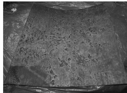
Bild 5: Rohrprobenstück nach Freilegen der blanken Oberfläche durch Sandstrahlung. Die Schädigungen der Rohrsubstanz durch graphitierte Bereiche werden sichtbar.