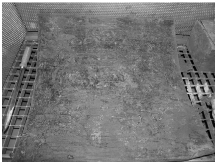
Bild 4: Rohrprobenstück vor der Untersuchung. Die Rohrwand weist keine offensichtlichen Schäden auf.

Eine anwenderorientierte Nutzung der materialtechnischen Zustandsbewertung wurde inzwischen erfolgreich in Zusammenarbeit mit entsprechenden Instituten und WVU begonnen und fortgeführt. Die Implementierung der materialtechnischen Zustandsbewertung nach dem hier entwickelten Verfahren hat sich in den entsprechenden WVU als hilfreiches Werkzeug zur Verbesserung und Optimierung der Planung von Instandhaltungsmaßnahmen bewährt. Die nachfolgenden Abbildungen ( Bild 4 und Bild 5 ) verdeutlichen die Notwendigkeit des Erkennens und Einschätzen von Rohrschäden sowie den Nutzen einer gezielten Untersuchung und Bewertung der Rohrsubstanz.